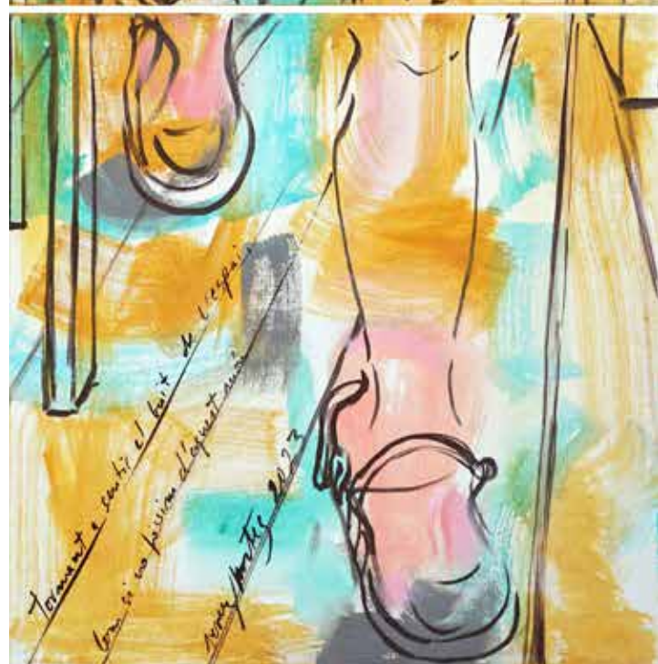
Àvies poderoses , acrílic sobre tela, 120 x 40 cm., 2023.