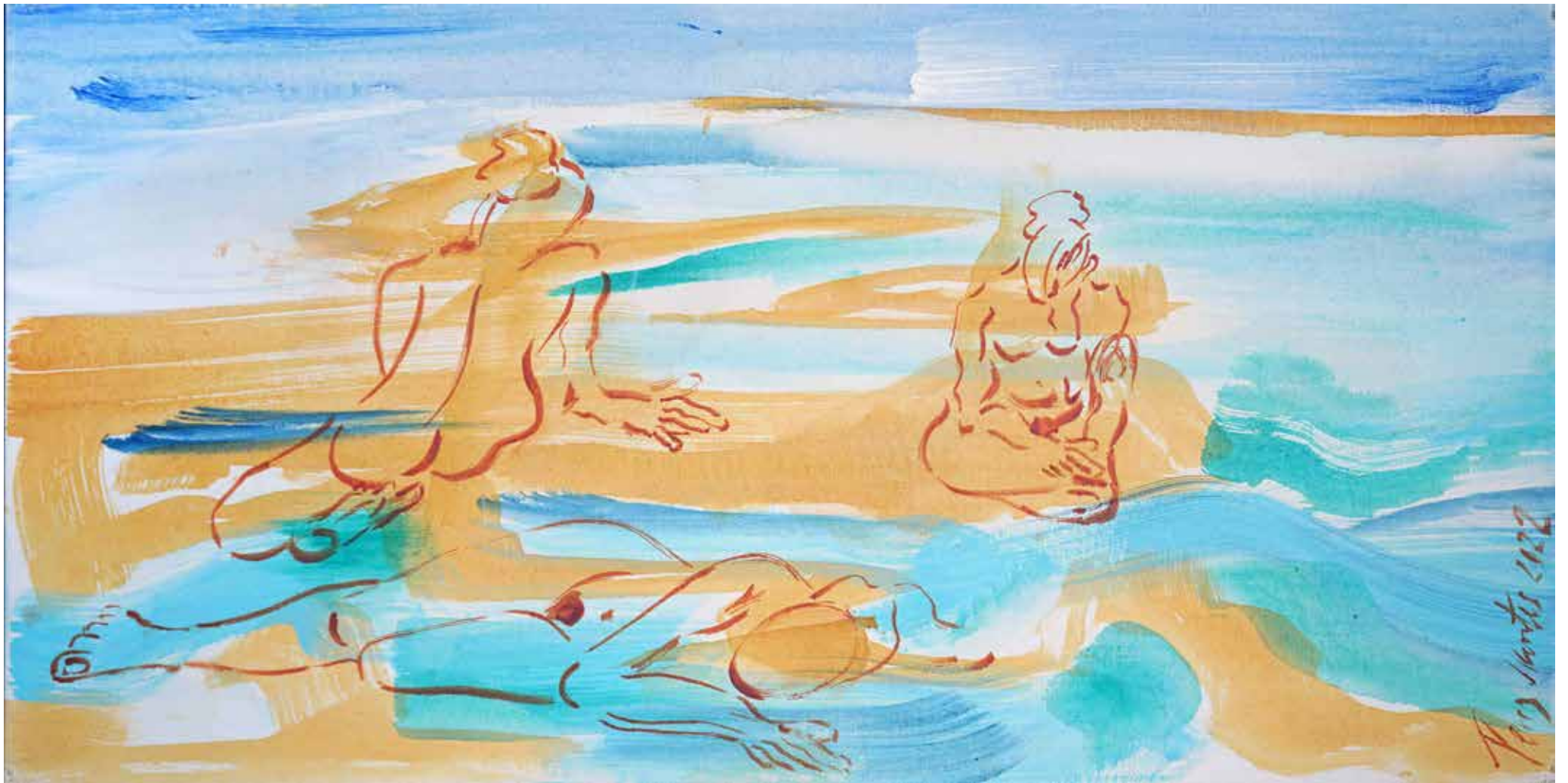
Sirenes , acrílic sobre tela, 80 x 40 cm., 2022.