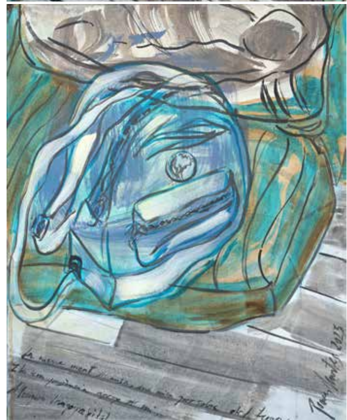
Un any d'Ucraina, acrílic sobre tela, 160 x 50 cm., 2023.