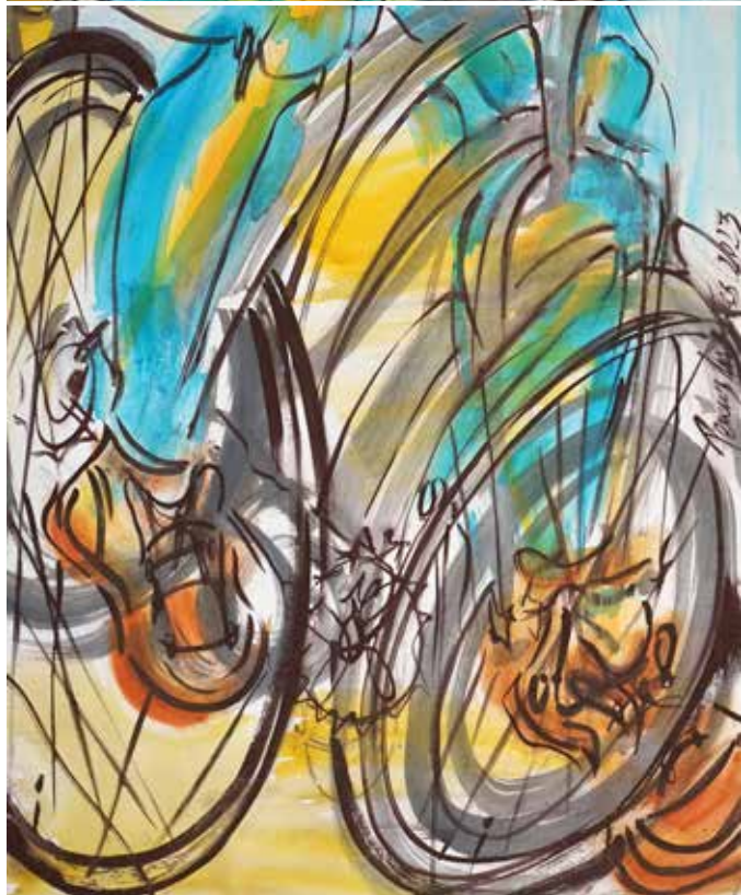
De volta a l'estany , acrílic sobre tela, 160 x 50 cm., 2023.