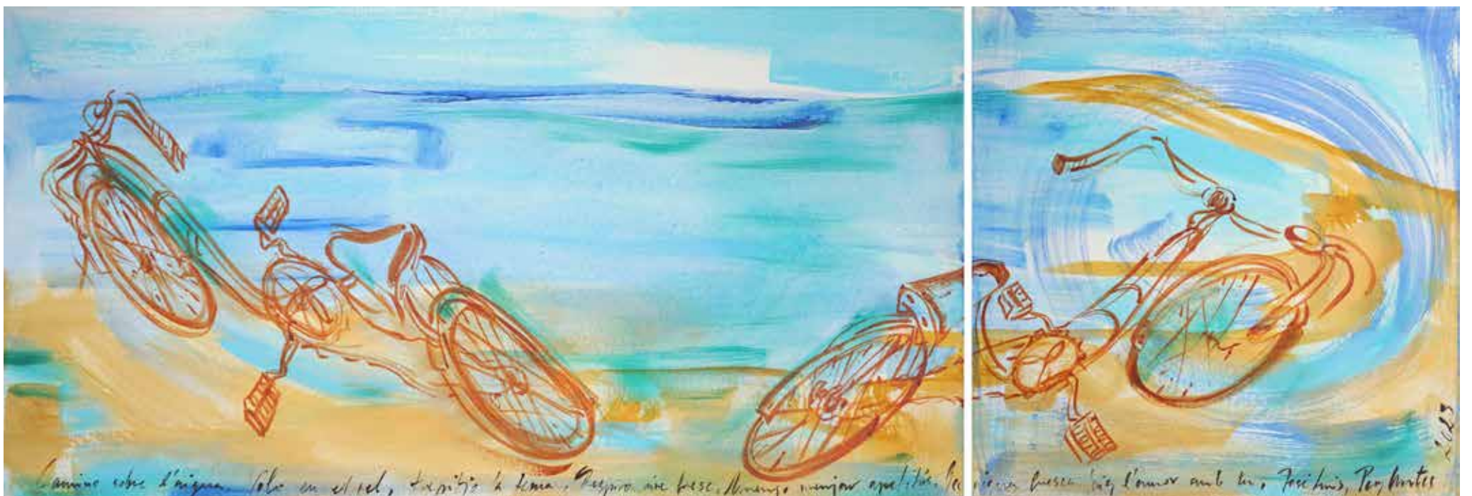
Camino sobre l'aigua , acrílic sobre tela, 150 x 50 cm., 2023.