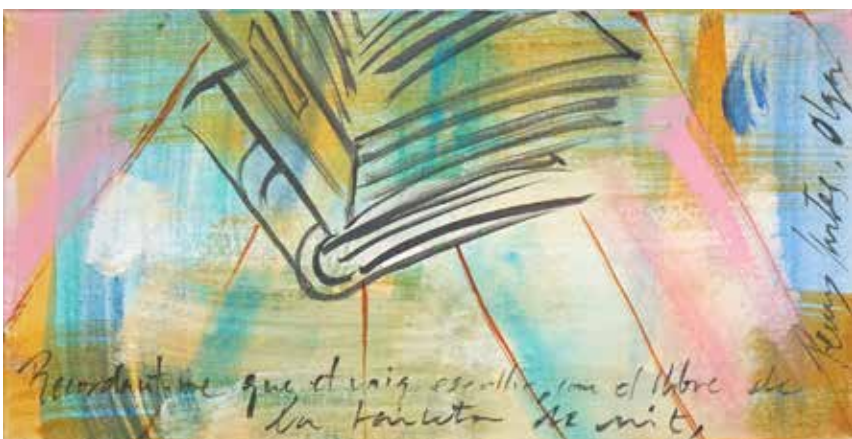
Tal com raja, acrílic sobre tela, 100 x 40 cm., 2023.