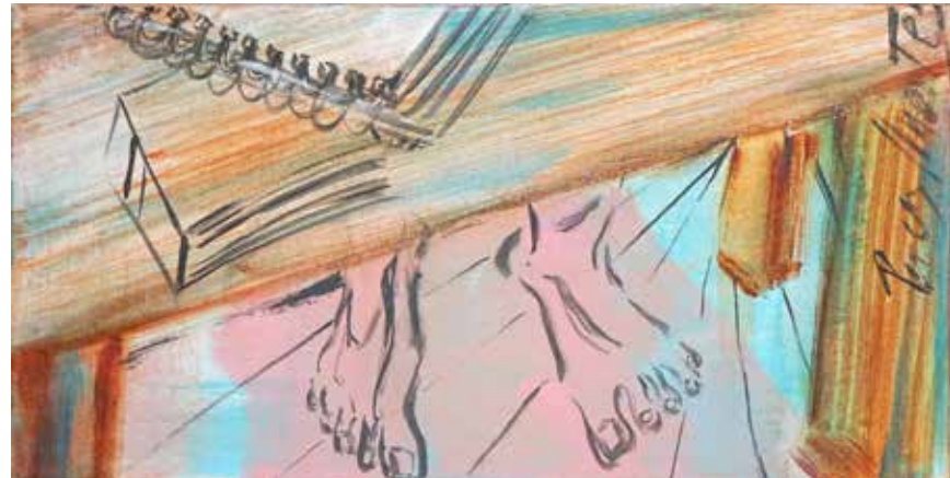
La vie en rose , acrílic sobre tela, 100 x 40 cm., 2023.