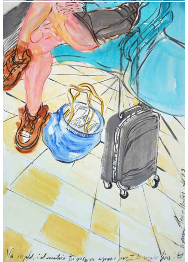
Catenària , acrílic sobre tela, 185 x 65 cm., 2023.