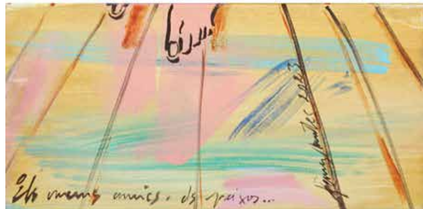
Els meus amics, els peixos! , acrílic sobre tela, 100 x 40 cm., 2023.