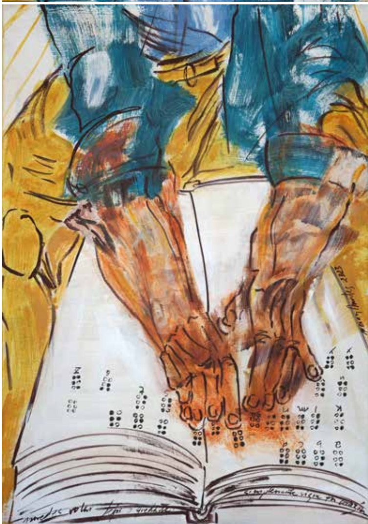
Braille, acrílic sobre tela, 185 x 65 cm., 2023.