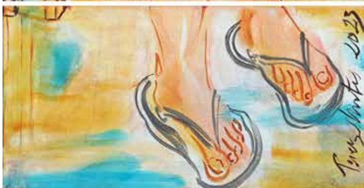
Un vermut , acrílic sobre tela, 120 x 40 cm., 2023.