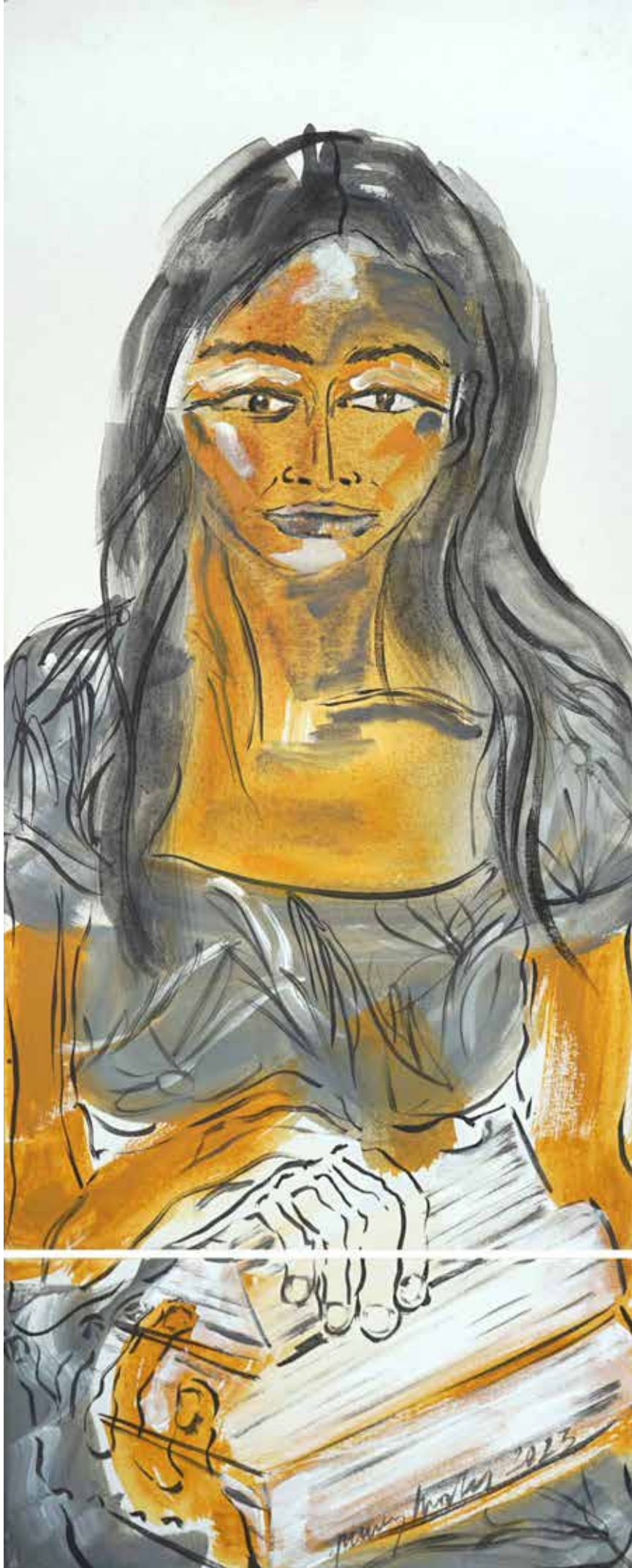
Sed de saber , acrílic sobre tela, 100 x 40 cm., 2023.