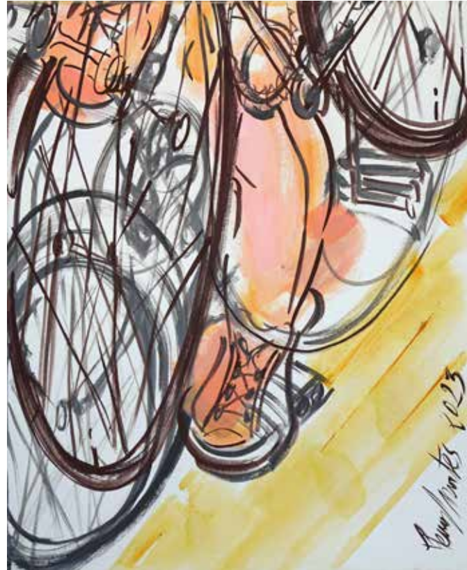
Pedals , acrílic sobre tela, 160 x 50 cm., 2023.