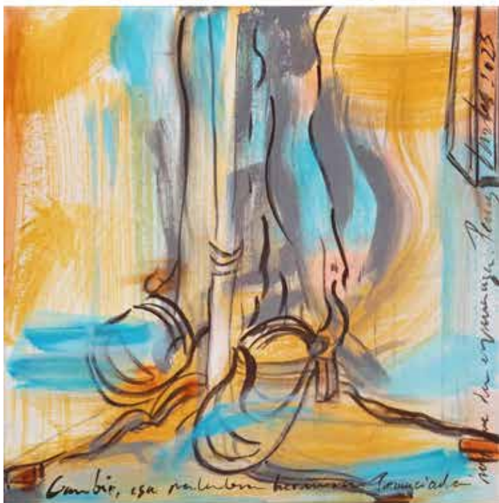
En clave de ser, acrílic sobre tela, 120 x 40 cm., 2023.