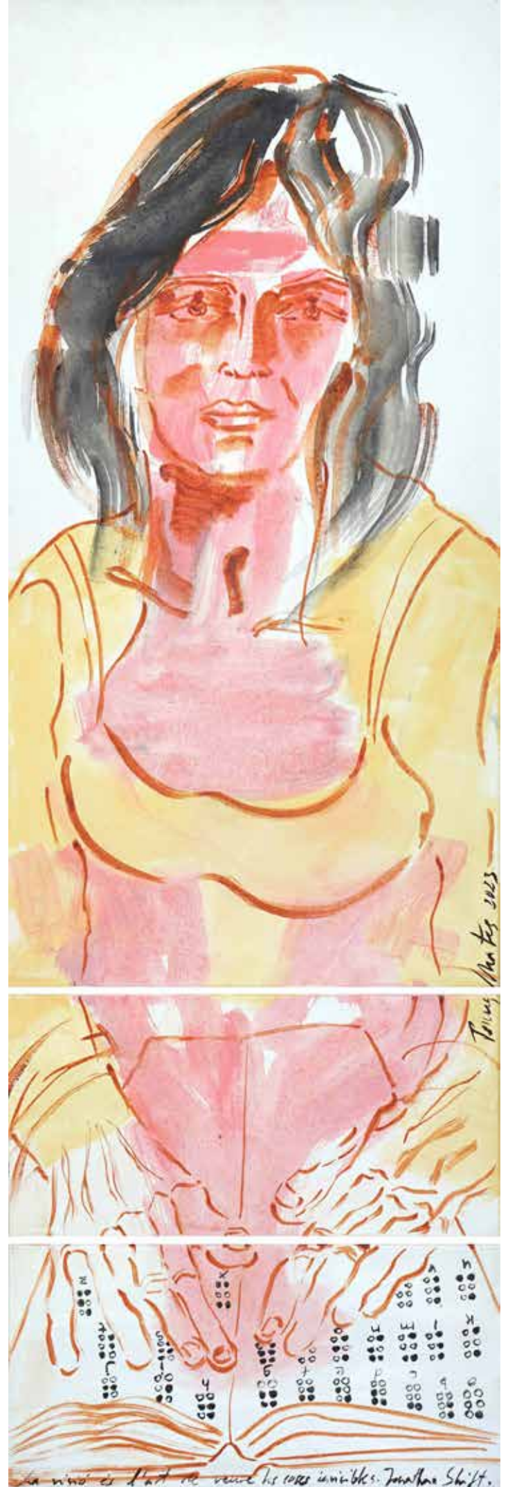
La visió és l'art de veure les coses invisibles , acrílic sobre tela, 120 x 40 cm., 2023.