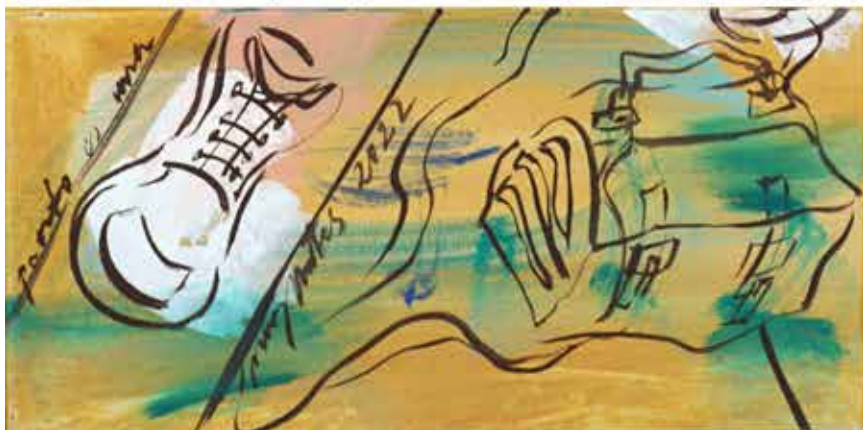
Pronto es una palabra bonita , acrílic sobre tela, 100 x 40 cm., 2022.