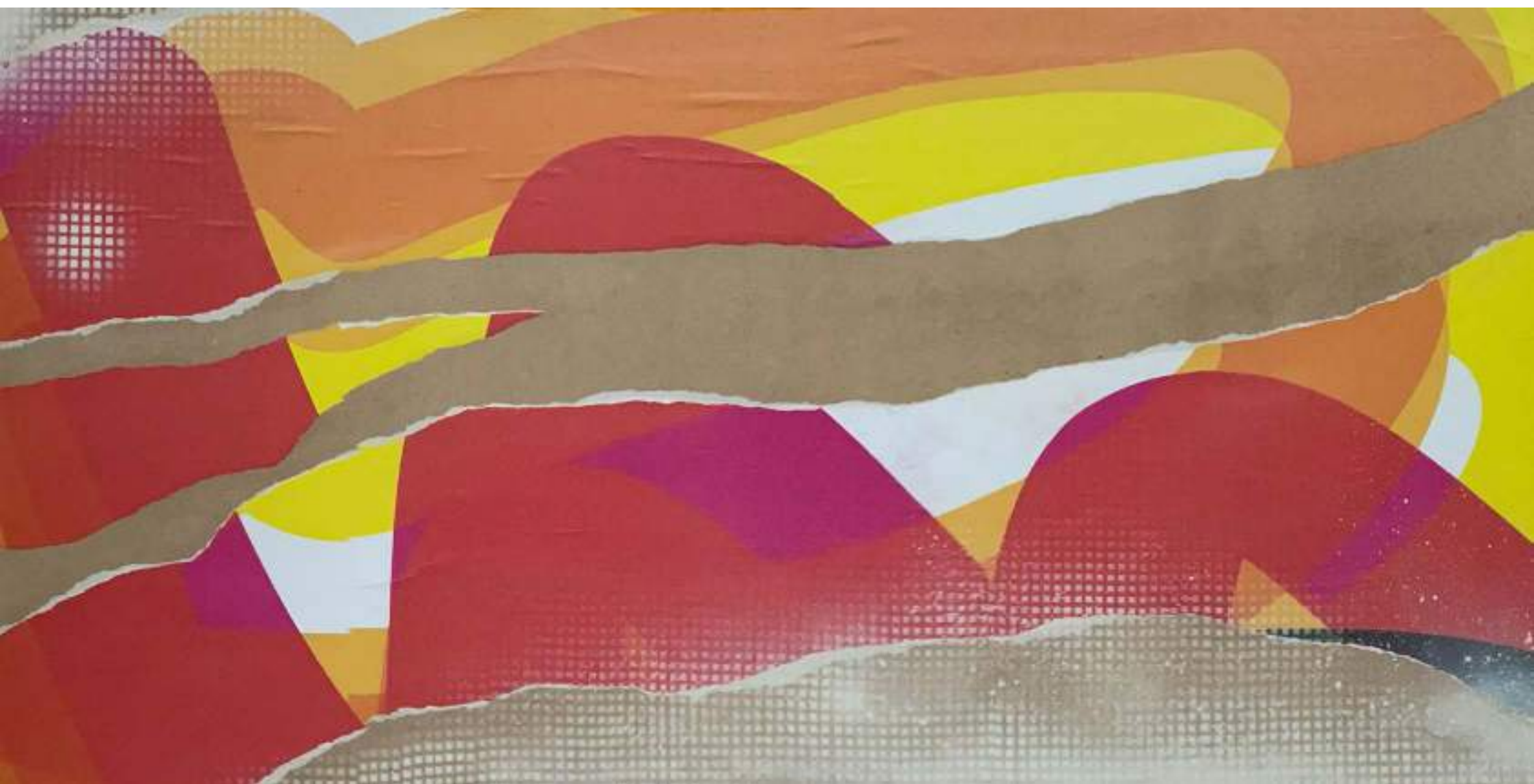
Horizó-me1. 120 x 60 cm.