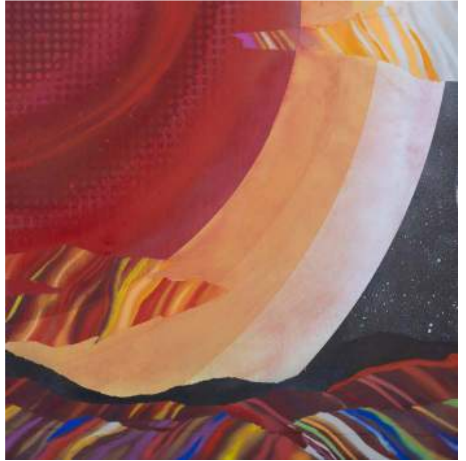
Landscape1-Landscape2. 100 x 100 cm. Spray i paper sobre fusta.