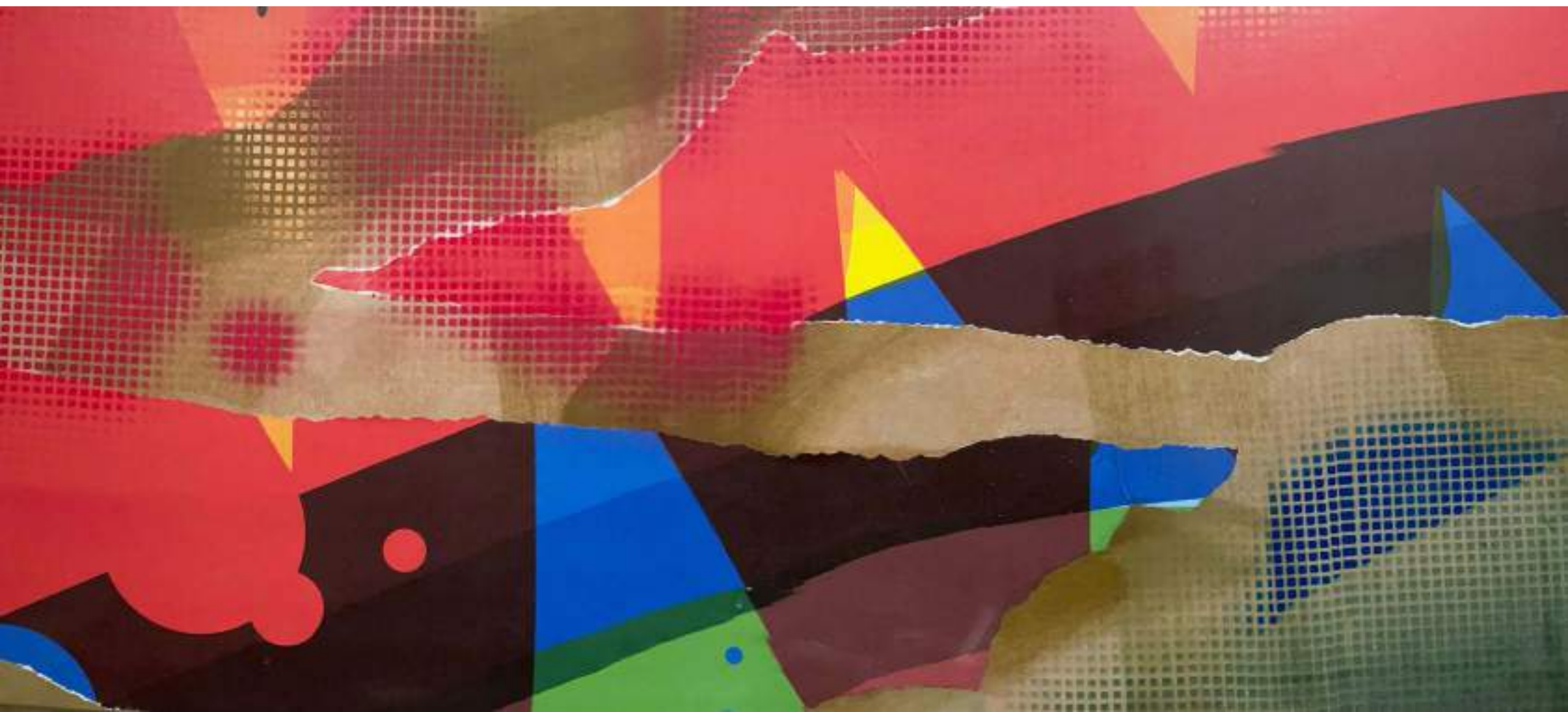
Horizó-me3. 120 x 60 cm.