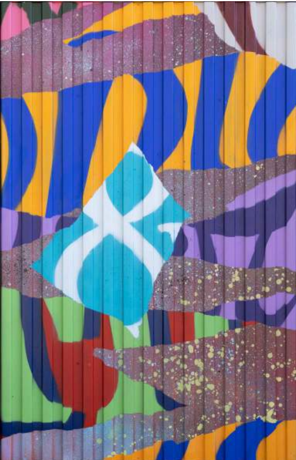
Valles despublicitades, esmalt sintètic en esprai sobre pegasus. 90 x 150 cm.