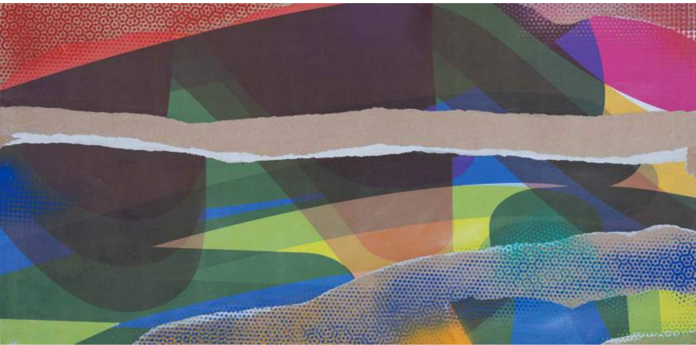
Horitzó-me4 . 120 x 60 cm. Spray i paper 120 gr. sobre fusta