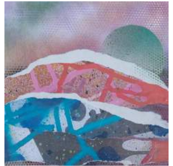
Branques. 50 x 50 cm. Spray i paper sobre fusta.