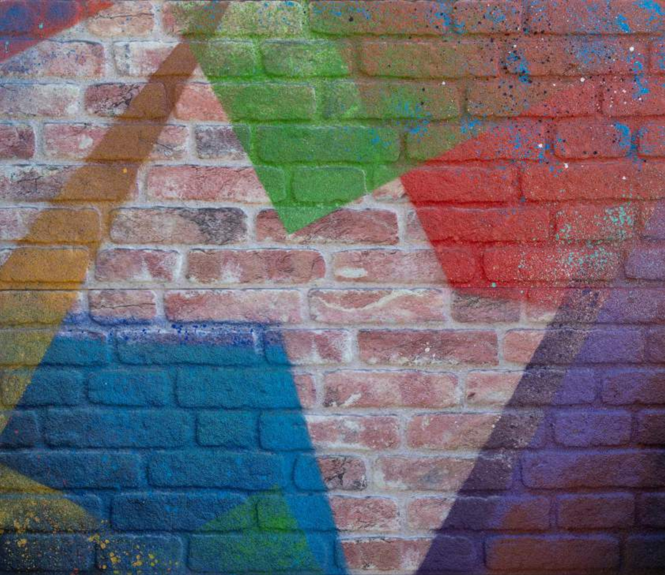
Extracció de mur. 120 x 95 cm. Spray.